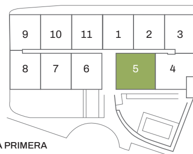
PLANTA PRIMERA FIRST FLOOR

Superficie Construida + PP de ZZCC Constructed area + P.P. of common areas