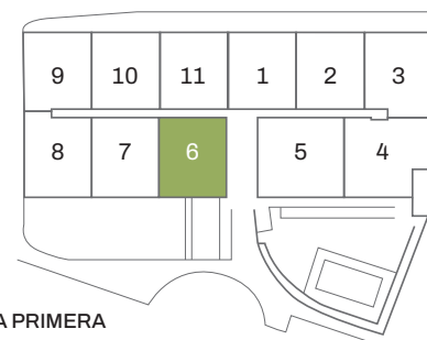
PLANTA PRIMERA FIRST FLOOR

Nota legal: No tiene carácter contractual ni precontractual y está sujeto a modificaciones